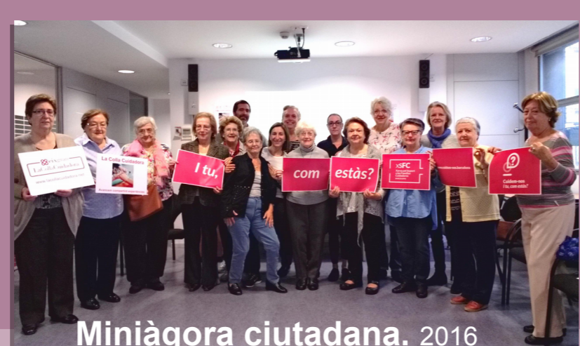
Miniàgora ciutadana. 2016