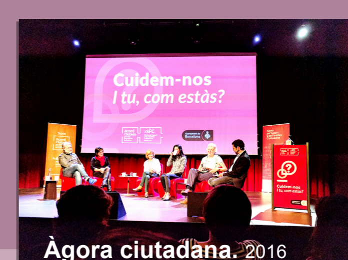
Àgora ciutadana. 2016