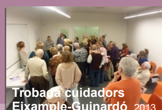
Trobada cuidadors Eixample-Guinardó 2013